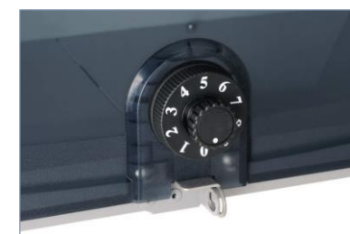
ダイヤル錠（防犯タイプ）付き

裏蓋は半透明の樹脂製で、蓋をあけずに郵便物を確認できます。 片手で郵便物を取り出せる裏蓋保持機能付きです。